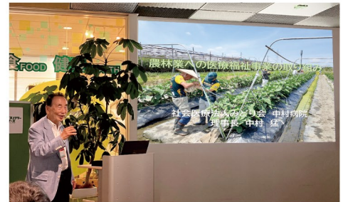
(未来の構想) 創立50周年に向けたリハビリ街道の緑化

芸術の秋、スポーツの秋がこれからも長く続きますように、春秋が短縮して夏冬の2季の日本の季節にならないよう祈りながら、今秋も元気で過ごしたいと思っております。